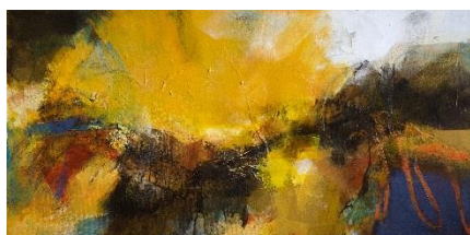
Artiste : Monique Guillet